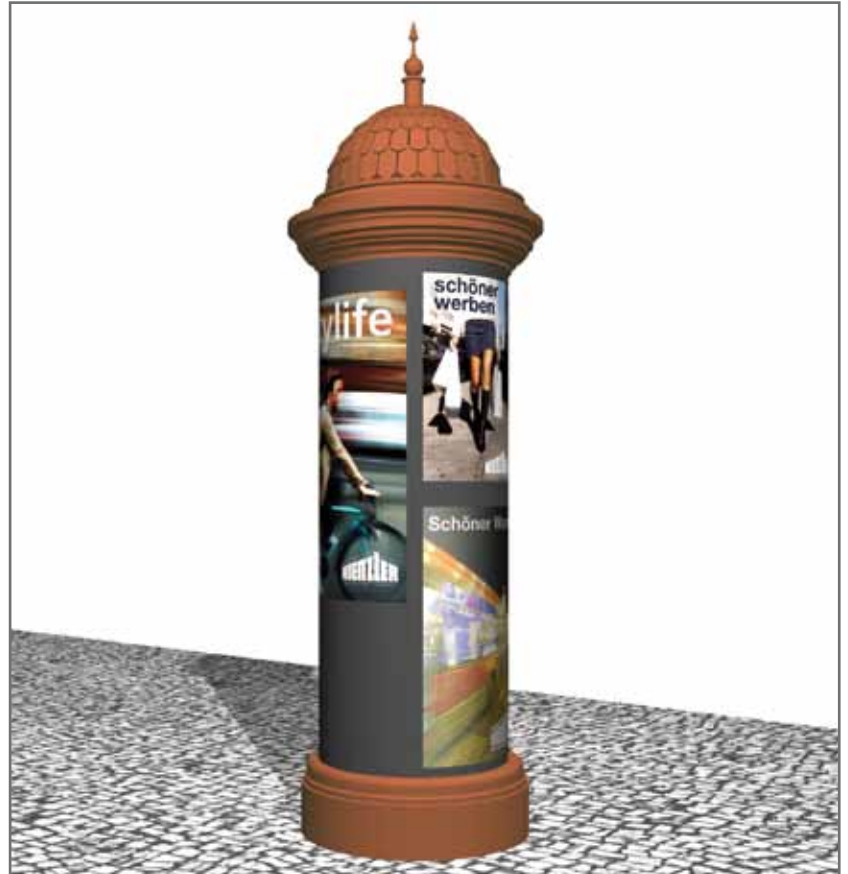
Die Berliner Litfaß-Säule. Ein Stück Werbegeschichte.