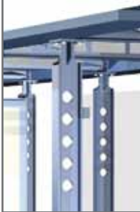
Variante K9W mit Kreuzstützen